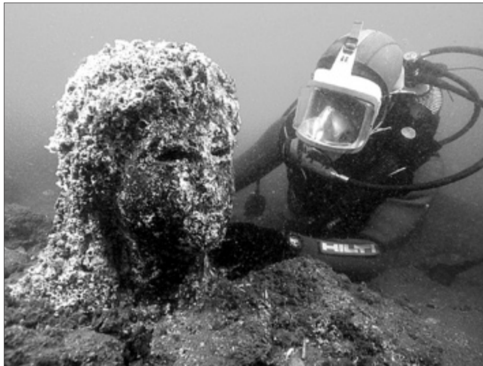
Arriba y abajo, piezas de arqueología halladas por el equipo de Goddio en Heraklion, el puerto de Alejandría, y que se exponen en Tesoros sumergidos de Egipto .

Aunque la San Diego era patrimonio español, se compró su cargamento por 3,5 millones de dólares