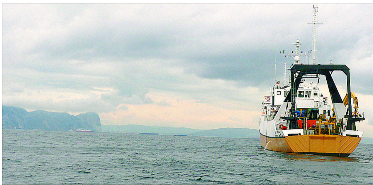
El Odyssey Explorer frente a Gibraltar, en enero de 2006, con el robot para extracción submarina en acción. P.S.

El ministro de Cultura, César Antonio Molina, expondrá hoy en Bruselas los hechos a sus colegas de la UE