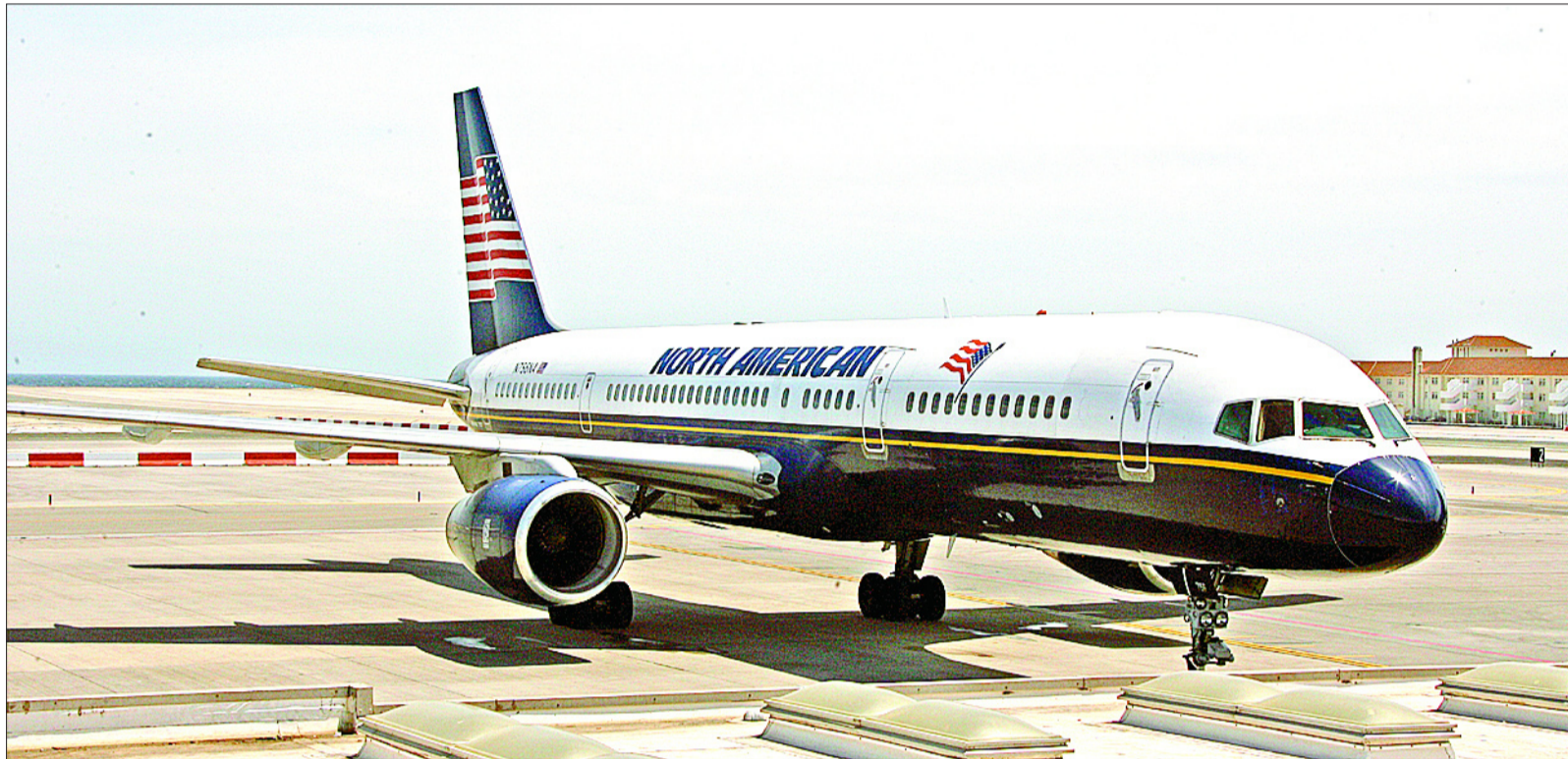
Boeing 757 de North American Airlines matrícula N756NA, estacionado en Gibraltar el 17 de mayo. Con él se exportó la mayor parte del tesoro. JOHNNY BUGEJA

Stemm se dio cuenta por una parte de que los andaluces siempre desconfiarían de él. Por otra parte, no había encontrado el Sussex . Pero en sus siete años de trabajo había localizado varios centenares de pecios, y al menos un tesoro. Decidió pasar a la