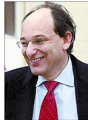
Peter Caruana, ministro principal de Gibraltar.

acción y el 10 de marzo de 2006 registró en Tampa el hallazgo de un barco unas 40 millas al suroeste de Inglaterra (presuntamente el Merchant Royal , hundido en 1641 transportando monedas para