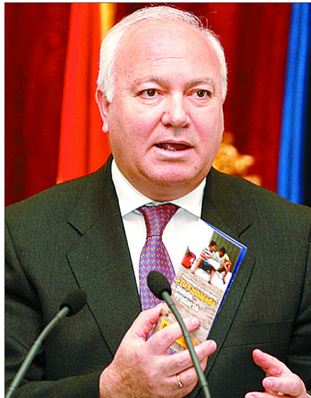
El departamento de Moratinos , buscando avanzar en el contencioso de Gibraltar, pasó por alto las exigencias de la Junta .