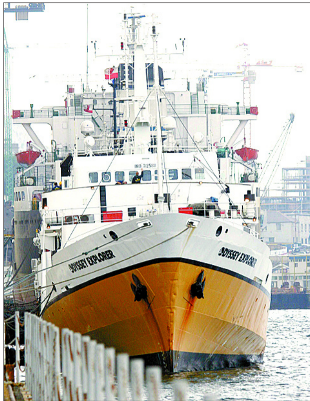
Odyssey , sabedora de que no recibiría permisos pero de que las aguas están en litigio, decidió obrar ilegalmente .