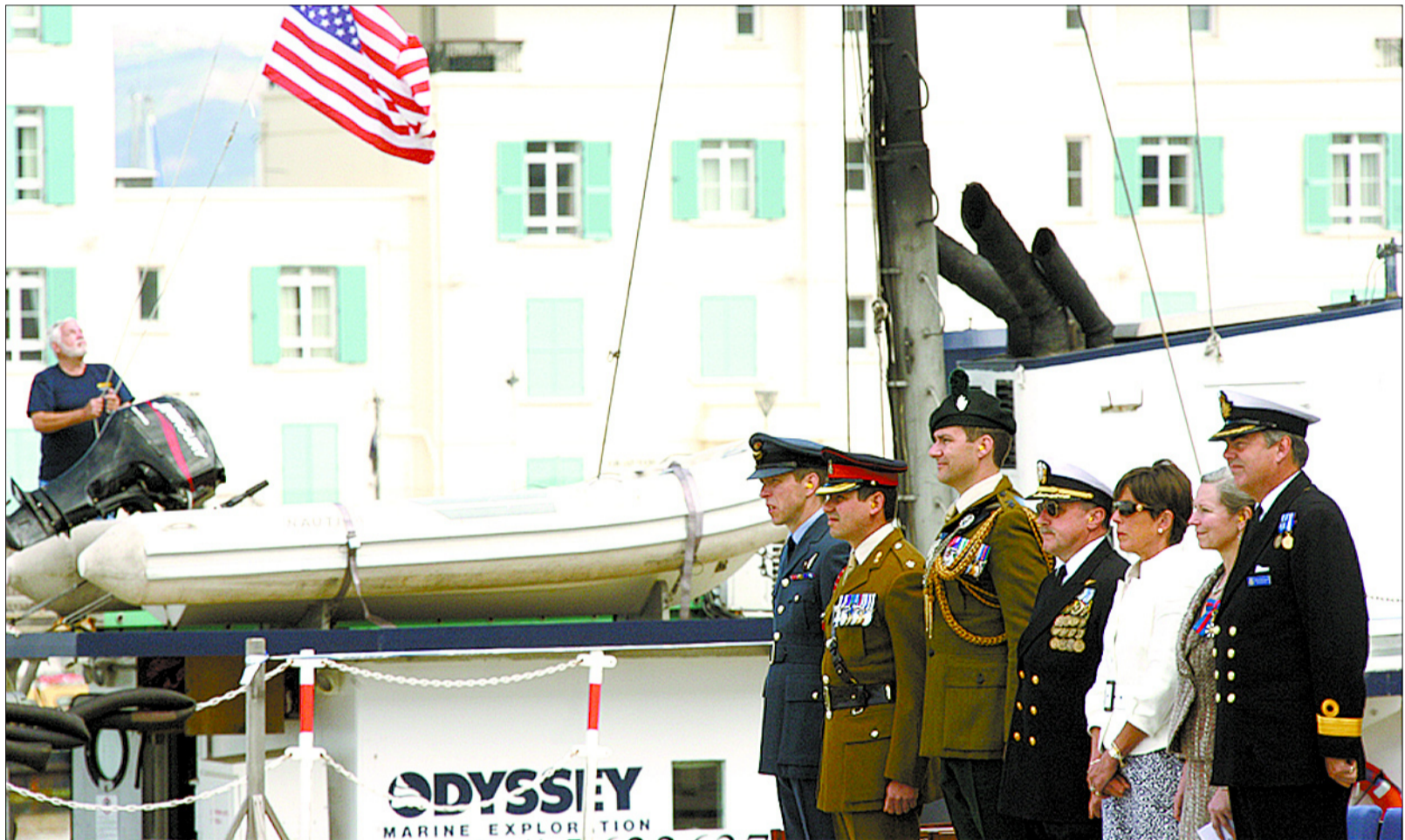
Militares británicos y el enlace norteamericano junto al RV Odyssey, en la celebración del 80º cumpleaños de la reina, el 21 de abril de 2006.