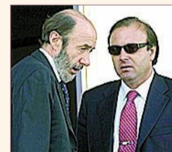
El ministro Rubalcaba con Joan Mesquida.

Cierra la tercera mejor semana del año, con una subida del 2,94%, y queda a un 1,6% del máximo histórico [P. 17 y 39]