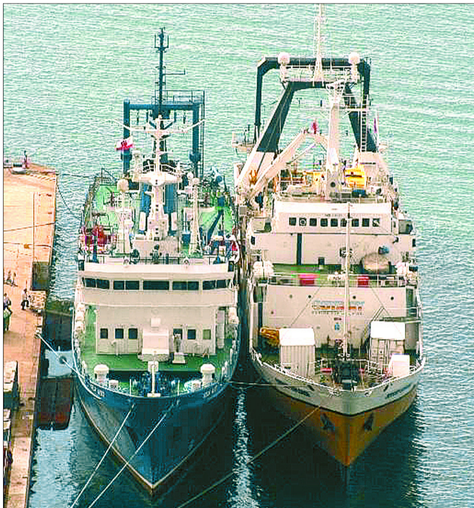
A la izquierda, el Ocean Alert y a la derecha el Odyssey Explorer , abarloados en el Mole South de la base naval británica de Gibraltar el pasado 27 de abril.

El tesoro que OME afirma haber hallado fortuitamente en el Atlántico, fue la gota que colmó la paciencia de cuantos sospechaban de las actividades de esta empresa cazatesoros. Entre