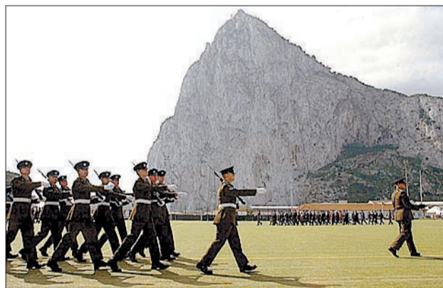
En la Roca hay mucho más de lo que se ve. En la imagen, desfile con motivo del tricentenario de la ocupación (2004).

do, como hubiera debido pasar si el tesoro hubiera sido el del Sussex y se hubiera extraído de acuerdo con las autoridades españolas. Claro que el acuerdo del 27 de septiembre de 2002 no menciona para nada a España.