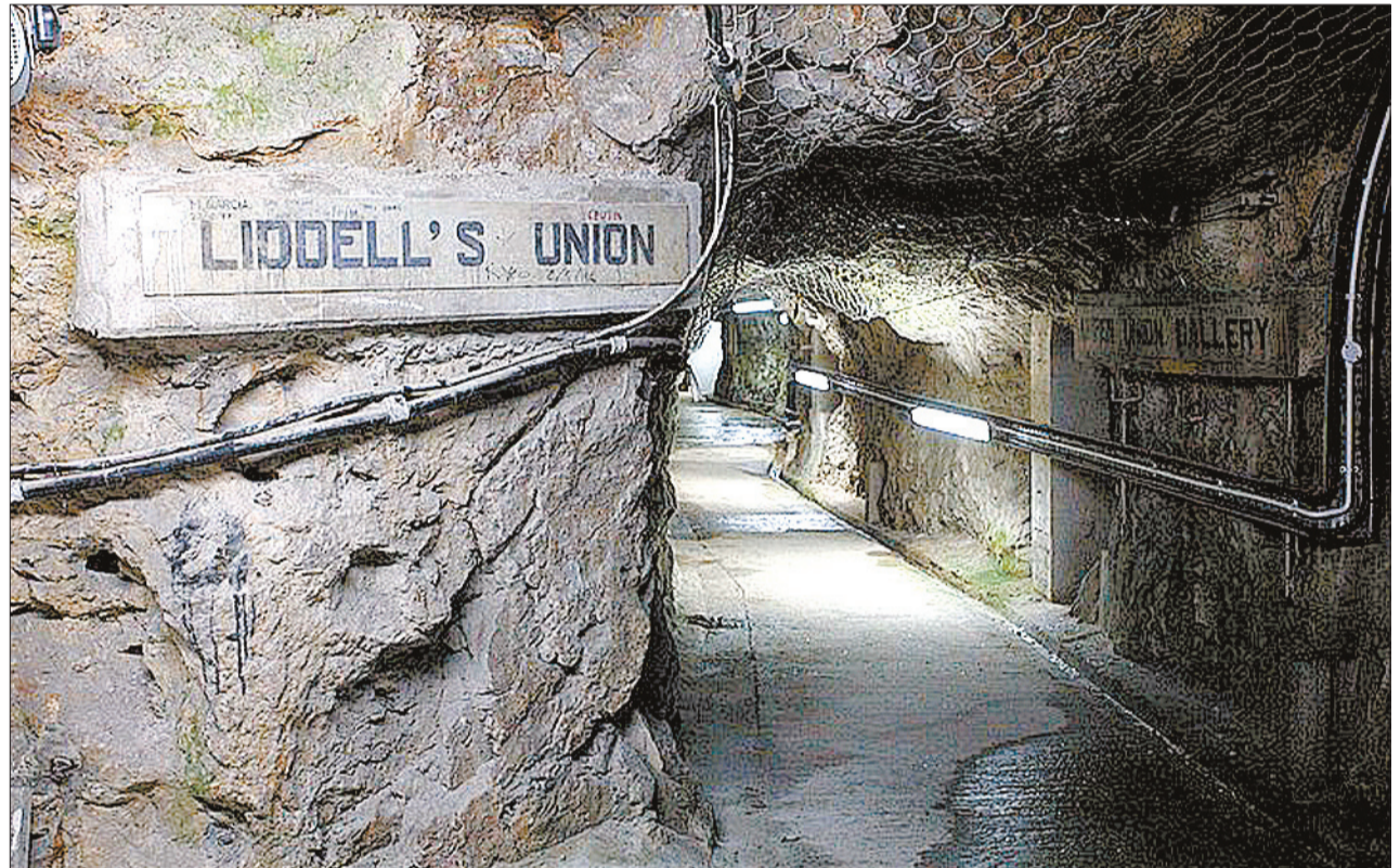
Uno de los túneles excavados durante la Segunda Guerra Mundial a los que se permite el acceso turístico.

El acuerdo firmado el 27 de septiembre de 2002 entre el Ministerio de Defensa británico y OME (puede consultarse en www.shipwreck.net/pam ) preveía en su punto 9.2 que expiraría "si el pecio no es el Sussex ". Por tanto, la presencia de los dos barcos de OME, Odyssey Explorer y Ocean Alert en la base naval (el segundo, además, consignado a nombre del Ministerio de Defensa) resulta injustificable. Igualmente lo sería que el tesoro fuera descargado en camiones militares e introducido en los túneles de la base, y que OME pudiera allí preparar su envío... no al Reino Uni-