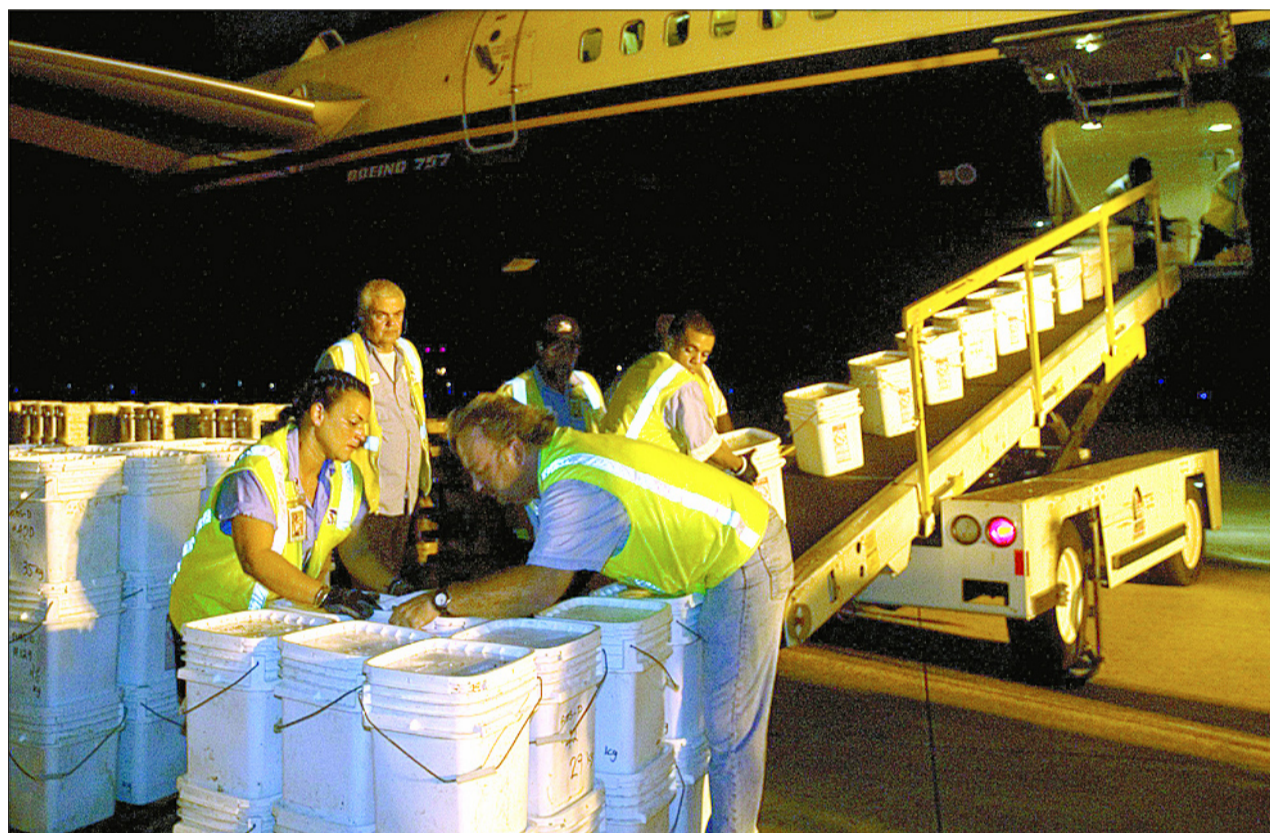
El avión de pasajeros N756NA en el aeropuerto de Tampa, donde llegó el viernes 18 procedente de Gibraltar.

Odyssey dice tener una licencia de exportación válida, garantizada por el país de origen (Gibraltar)