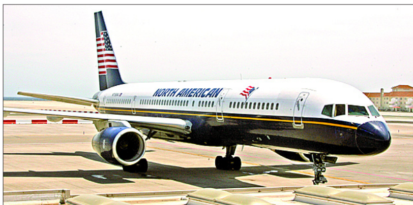
N756NA, el Boeing 757 de North American del que Odyssey descargó el tesoro en Tampa, antes de despegar con su carga de Gibraltar el jueves. JOHN BUJEJA

Es inexplicable que las fuerzas de seguridad no hayan intervenido antes con la contundencia y la rotundidad con la que hubiera actuado cualquier país que ve violadas y profanadas sus aguas territoriales.